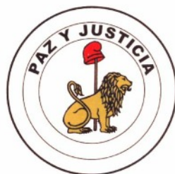
Escudo de la República Reverso

Příloha dekretu neobsahuje vyobrazení vlajky. Obsahuje však barevné vyobrazení znaku a pečeti, popis jejich částí a kódy použitých barev ve vzorníku Pantone, v CMYK a RGB. Je také stanoven font písma opisů – Arial Black. Vnější průměr mezikruží ve znacích je podle vyobrazení asi deset dvanáctin jejich průměru.