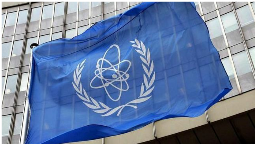
Vlajka MAAE před jejím sídlem ve Vídni

IAEA Information Circular, INFCIRC/581 ze dne 17. 11. 1999