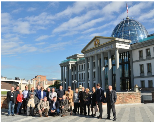
Společná fotografie účastníků konference před prezidentským palácem v Tbilisi.