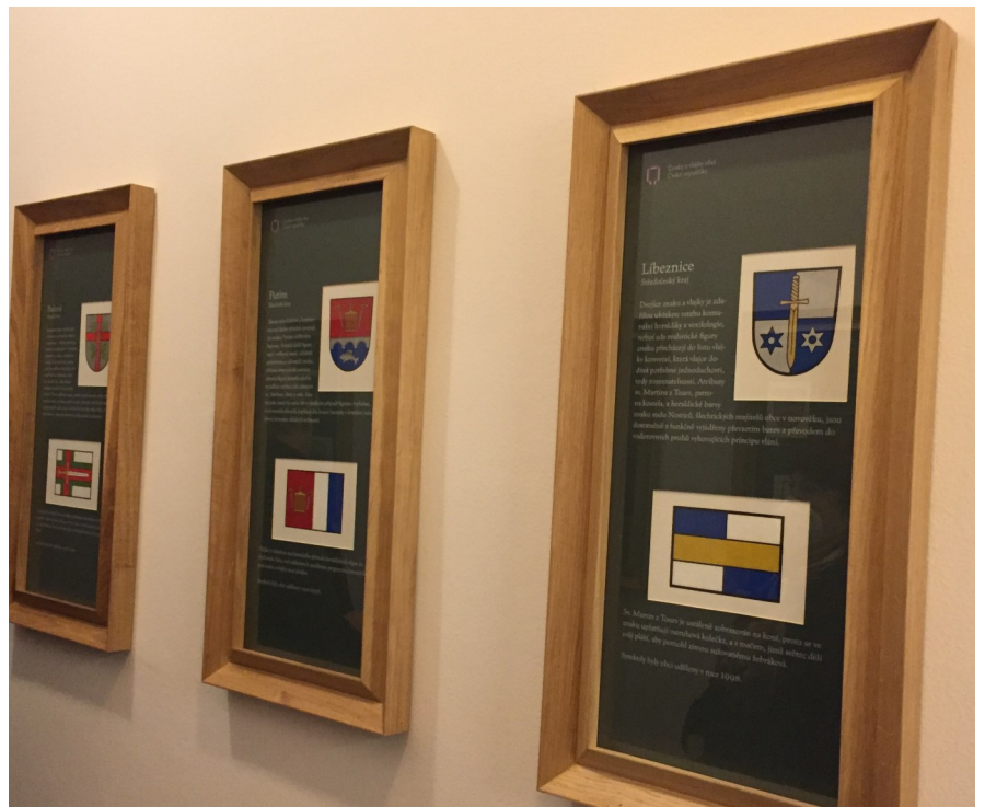
Výstava znaků a vlajek obcí České republiky je od podzimu roku 2020 instalována v budově parlamentu ve Sněmovní ulici č. 3.