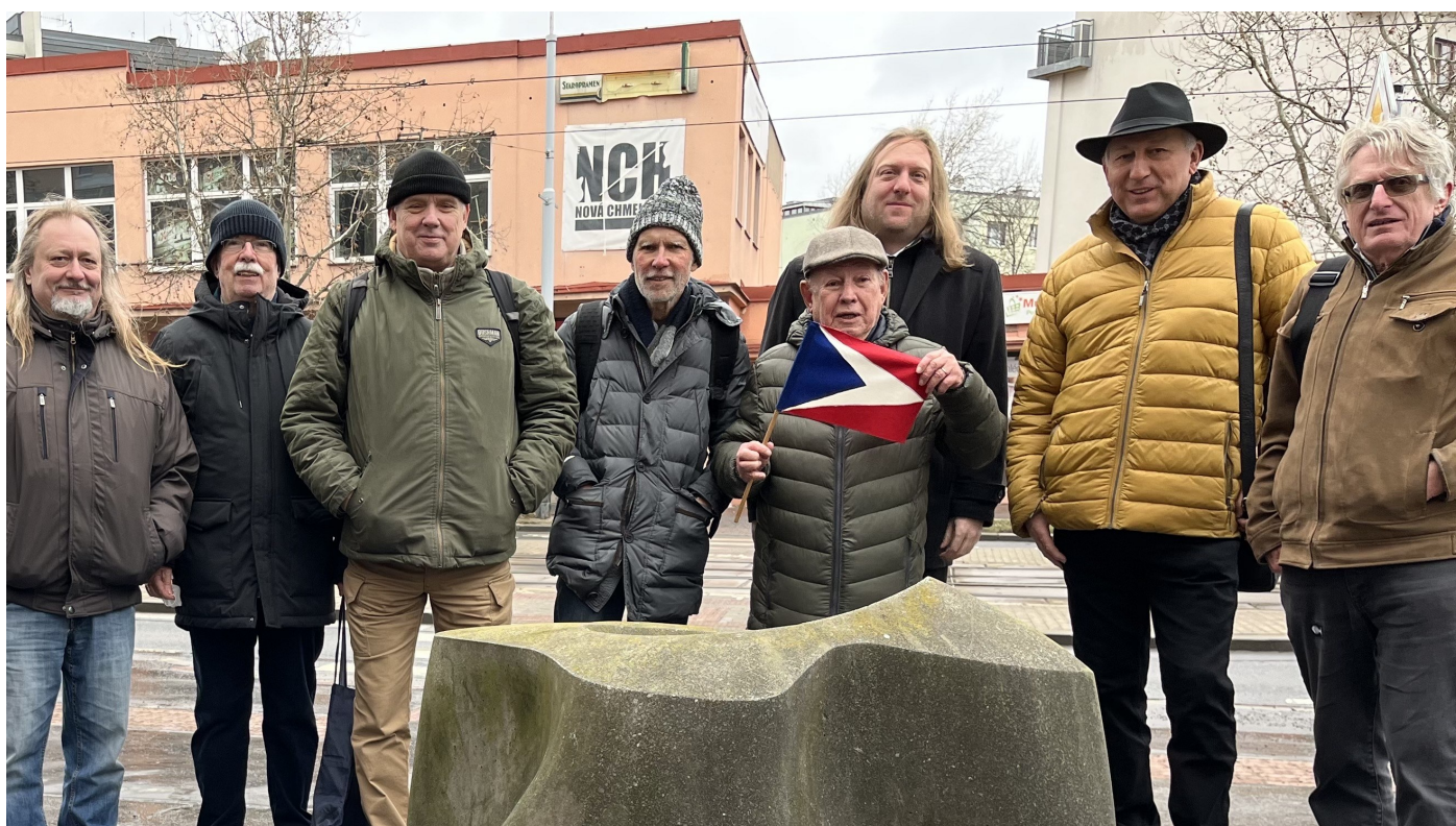
Členové České vexilologické společnosti před budovou bývalého Obvodního kulturního domu v Praze 3 dne 29. ledna 2022.