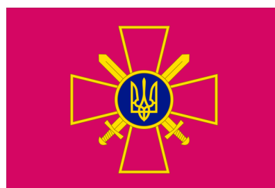
vlajka pozemních sil