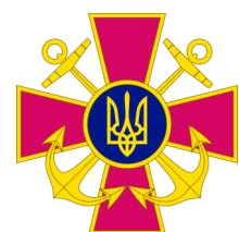
vlajka a emblém námořnictva