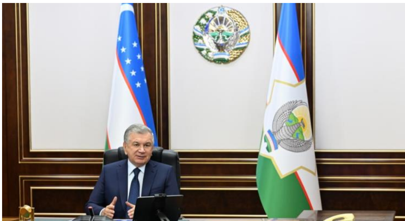
Fotografie s vlajkou prezidenta byla uveřejněna na webových stránkách prezidenta https://president.uz/en/lists/view/6524 s datem 31. 7. 2023