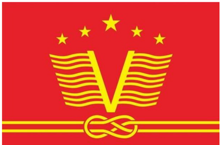
Vlajka 30. mezinárodního vexilologického kongresu.

https://fiav.org/wp-content/uploads/2023/09/Info-FIAV-57-1.pdf